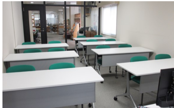
新たに整備したミーティングルーム

附属図書館において、ミーティングルーム及びラーニングコモンズエリアを整備。学生が利用できるフリースペースであるとともに、アクティブラーニングも含めて講義・演習の一部を実施することが可能となりました。