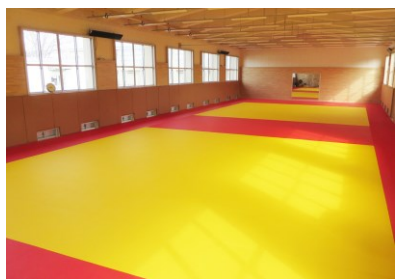
柔道場、合気道場の畳を新調

老朽化していた文京町キャンパスにある武道場を、国からの補助を受け改修するにあわせ、施設と同様に老朽化していた柔道場等の畳や防護マット、床マットなどの備品・什器類について環境整備を行いました。