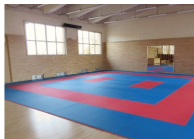
空手道場の床マットを新調