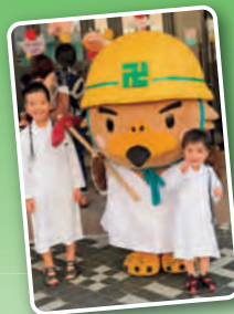
弘前市マスコットキャラクター たか丸くん